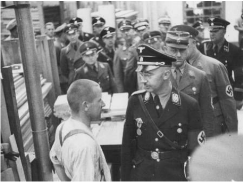
Mai 1936: Heinrich Himmler, Reichsführer SS und bald auch Chef der Deutschen Polizei, spricht zu einem Häftling im KZ Dachau.

Eine KZ-Gedenkstätte ist ein Ort des Gedenkens an die Opfer. Zugleich ist sie ein ehemaliger Tatort. Menschen haben dort andere erniedrigt, gepeinigt, ermordet.