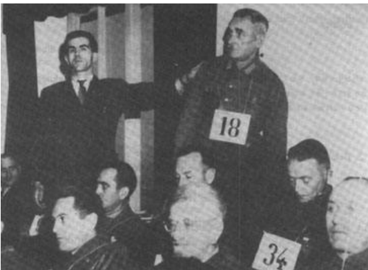
Ende 1945: Ein Belastungszeuge identifiziert im ersten Dachauer Prozess einen angeklagten SS-Oberscharführer.