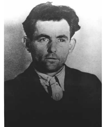
"Ich habe den Krieg verhindern wollen." Der Hitler-Attentäter Georg Elser, Häftling im KZ Dachau bis zu seiner Ermordung im April 1945.