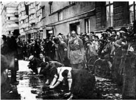
Mittäter – Mitläufer – Zuschauer – Wegschauer. Wien im März 1938: Juden werden gezwungen, Bürgersteige zu putzen

Wie in einer → Überblicksführung erhalten Sie Informationen und Berichte zum System der Konzentrationslager, zur Geschichte des KZ Dachau und zum Schicksal seiner Häftlinge. Sie suchen die authentischen Orte im einstigen Lager auf sowie ausgewählte Exponate in der neu gestalteten Ausstellung. Der Dokumentarfilm KZ Dachau schildert Leiden, Sterben und Befreiung der Häftlinge.