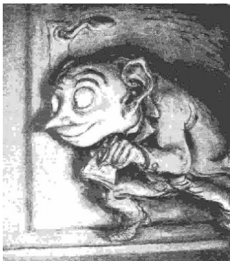
"Der Denunziant" von A. Paul Weber, 1943. Massenhafte Denunziationen und eine Atmosphäre von Angst und Misstrauen waren Säulen des NS-Terrors.